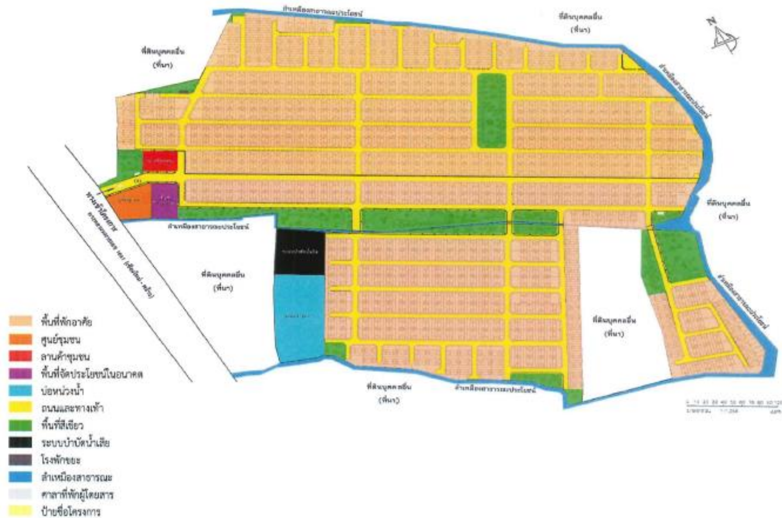
รูปที่ 1-2 ผังบริเวณและส่วนประกอบของโครงการตามที่เสนอไว้ในรายงานการประเมินผลกระทบสิ่งแวดล้อม (EIA)