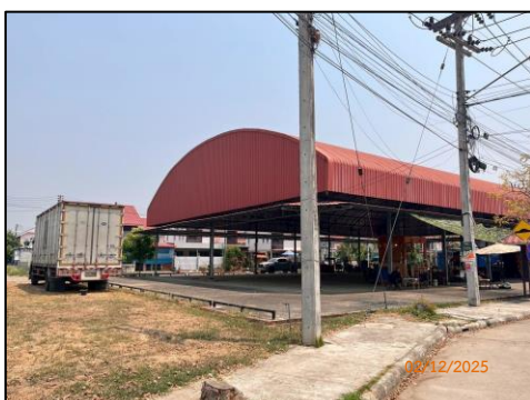
ลานค้าชุมชน