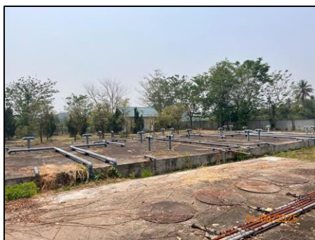
ระบบบำบัดน้ำเสีย