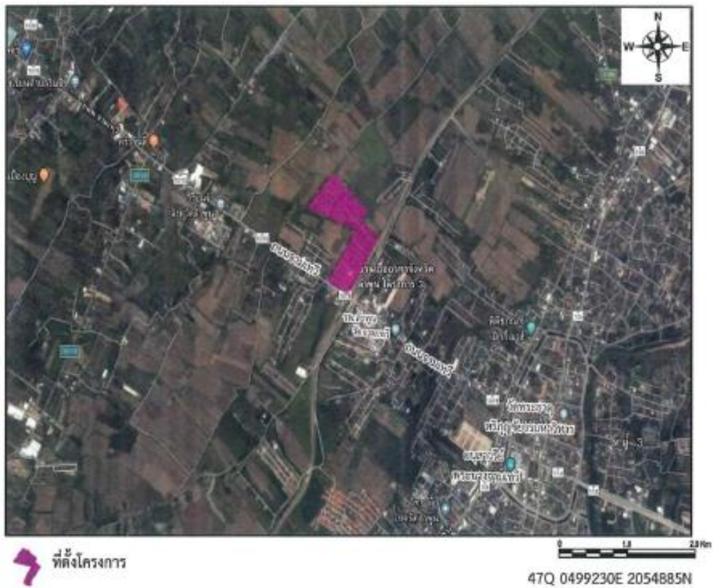
รูปที่ 1-1 ที่ตั้งโครงการ