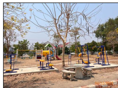
สนามเด็กเล่น