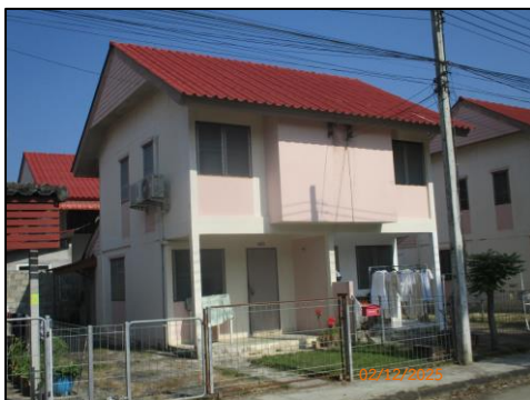
บ้านแฝด 2 ชั้น