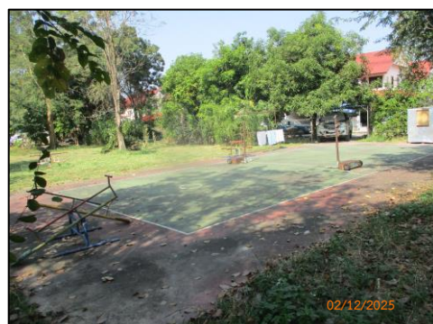
สนามกีฬา