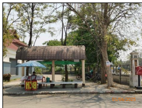
ศาลาพักผ่อนโดยสธาร