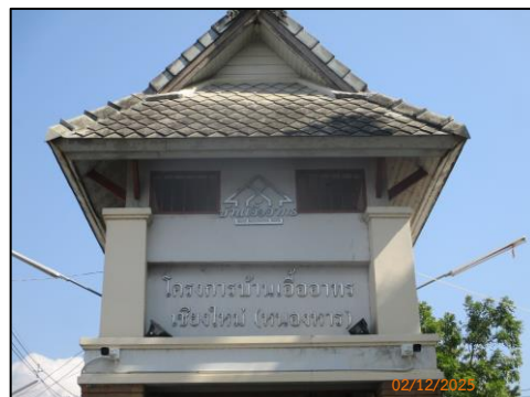
ป้ายโครงการ