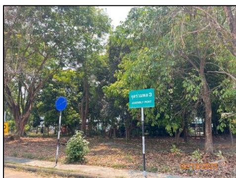
พื้นที่สีเขียว